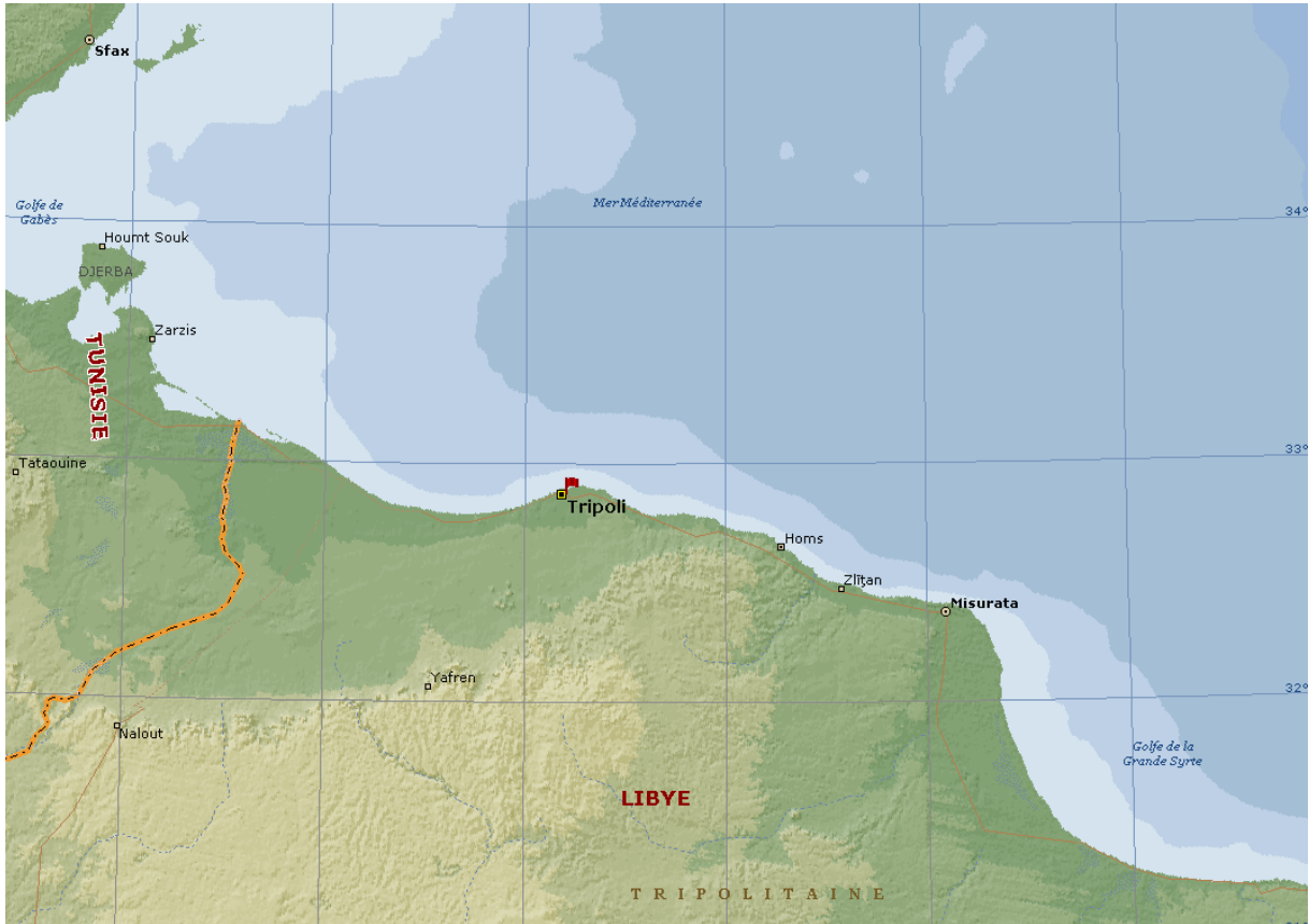
Largeur horizontale du quadrillage = 100 km