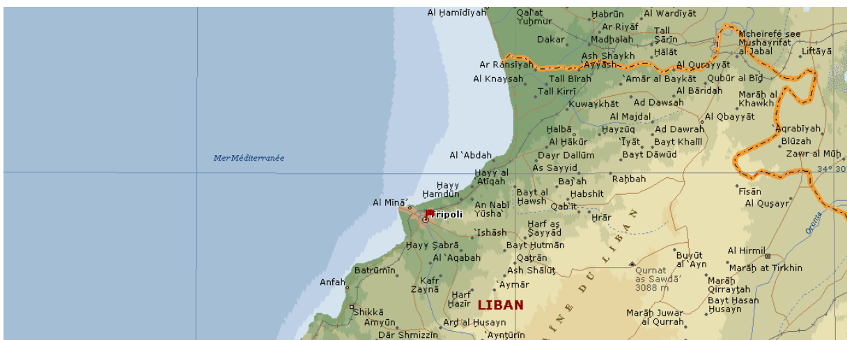
Segment horizontal du quadrillage \approx 40 km.