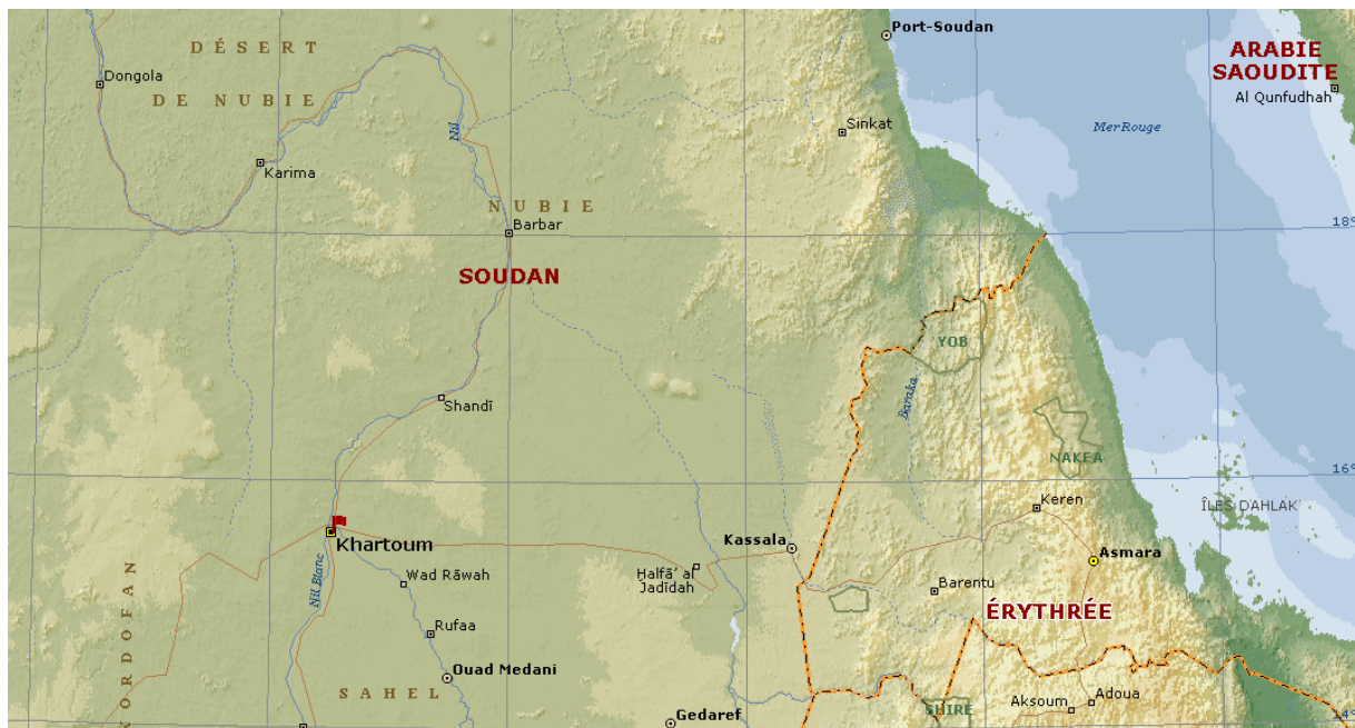
Segment horizontal du quadrillage \approx 200 km.

http://www.lepoint.fr/monde/un-americain-tue-dans-l-attaque-du-consulat-americain-a-benghazi-en-libye-12-09-2012-1505213_24.php