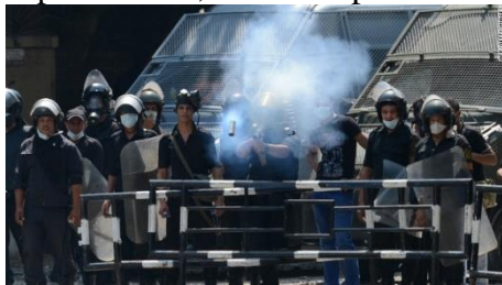
Cairo police fire tear gas at protesters

September 15, 2012 -- Updated 0040 GMT (0840 HKT)