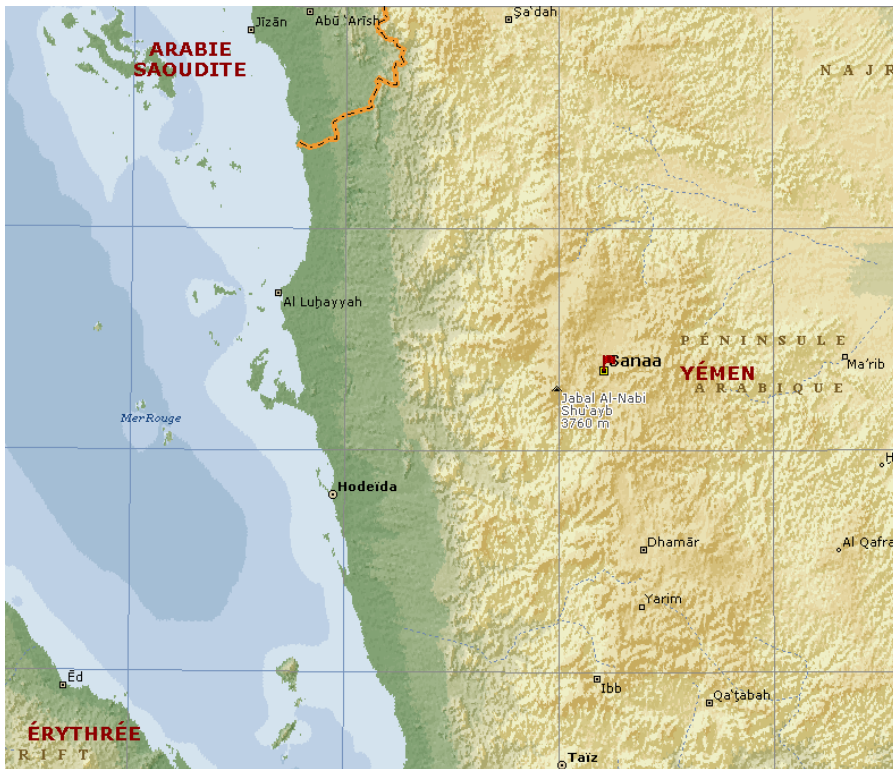
Segment horizontal du quadrillage \approx 100 km