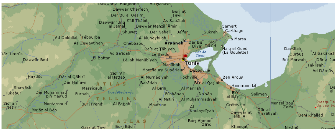
Segment horizontal du quadrillage \approx 45 km.