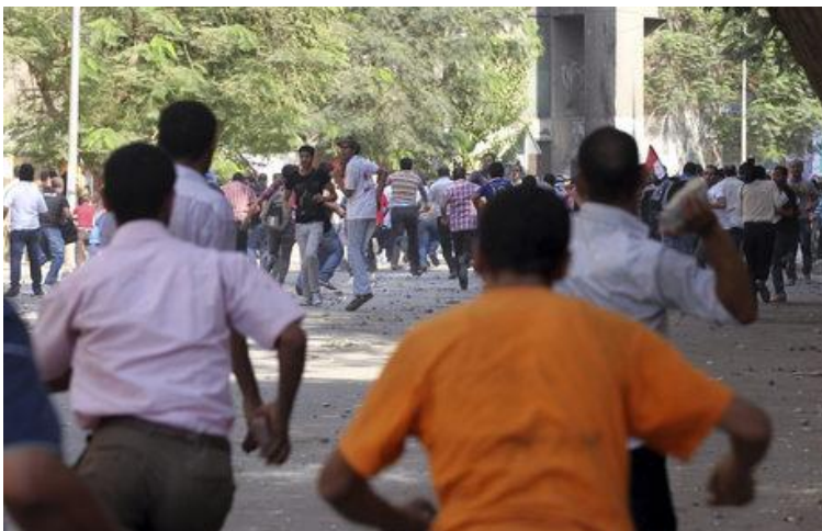
Enfrentamientos en el centro de El Cairo.

Se registraron choques entre cientos de partidarios de los Hermanos Musulmanes, grupo al que pertenecía Mursi antes de acceder a la presidencia, y opositores al mandatario.