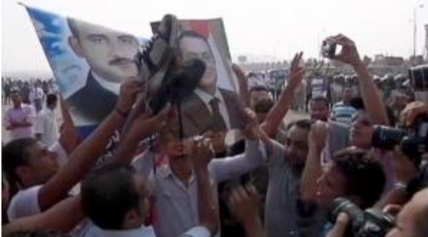
First witnesses heard in Mubarak trial