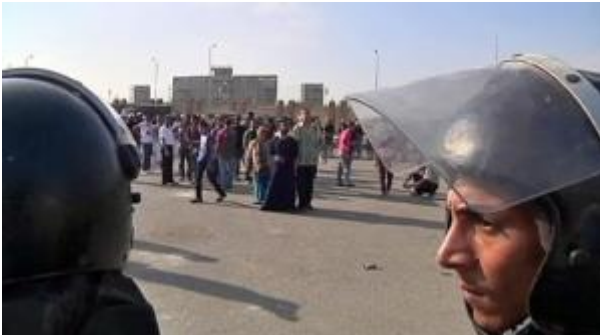
Mubarak's trial under high security