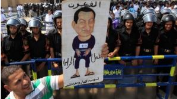
Clashes outside court as Mubarak trial resumes