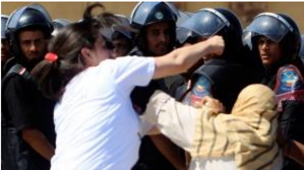
Mubarak supporters and opponents clash